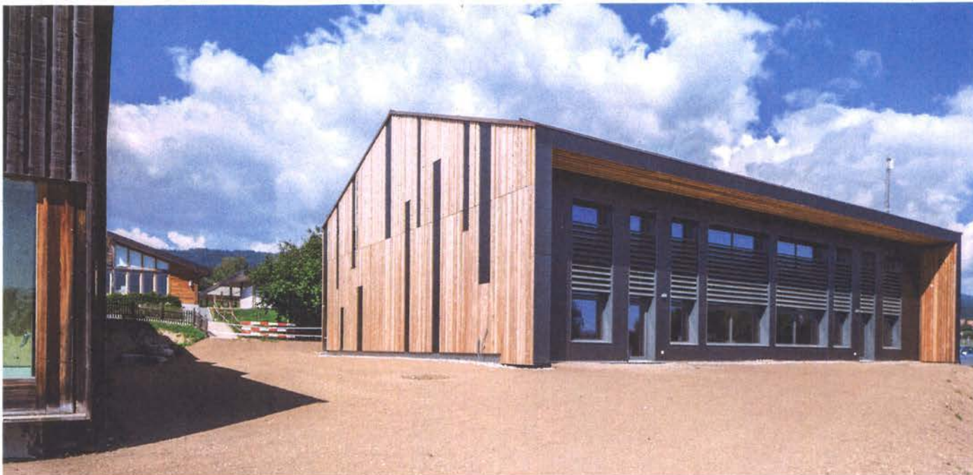
Tout le quartier scolaire de Bassins valorise le bois des forêts communales. Cela a commencé en 2002, puis 2008 et 2010, avec les salles de classe (en arrière-plan). A gauche, on devine la piscine achevée en 2004. Dernière perle : la salle de gymnastique qui accueillera aussi le Conseil communal.