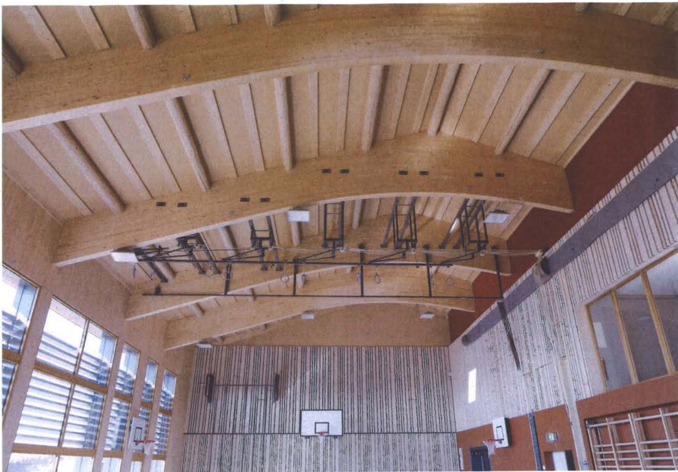
A l'intérieur, les poutres en toiture ont été laissées à l'état brut. Un aspect naturel avec tous ses noeuds et imperfections qui est voulu et assumé. Les enfants peuvent ainsi visualiser les troncs et garder à l'esprit que cette salle a été réalisée avec les arbres des forêts qui les entourent.